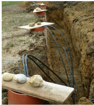
Kinette für das Verlegen der Verbindungsschläuche