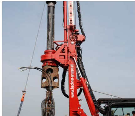
Drehbohrgerät Delmag RH6 mit einem Einsatzgewicht von ca. 26,5t