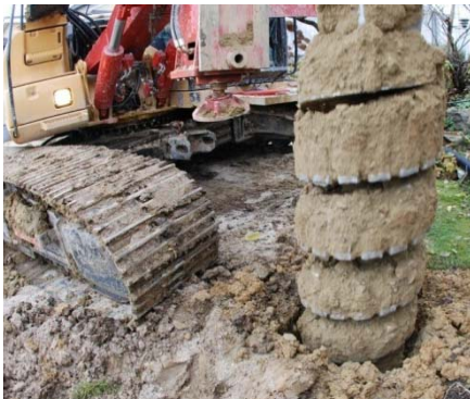
bohren der 12m tiefen 620mm Durchmesser Bohrungen