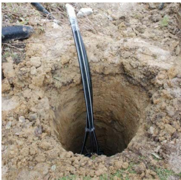
eingebaute BACHNER Energiesäule