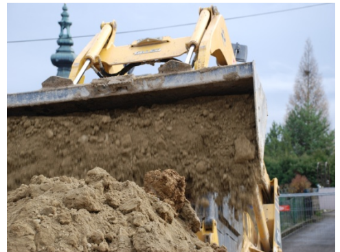
abtransportieren des überschüssigen Materials