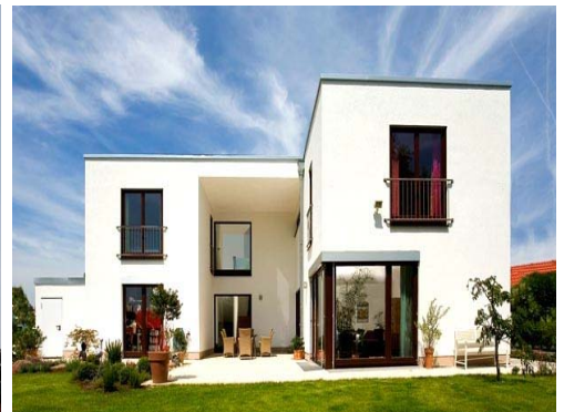
Heizen und Kühlen mit Erdwärme

Alles aus einer Hand! Die BACHNER Energiesäulen werden im eigenen Haus produziert und qualitätsgeprüft. Die Projektdurchführung beinhaltet Beratung, Planung und Umsetzung vor Ort.