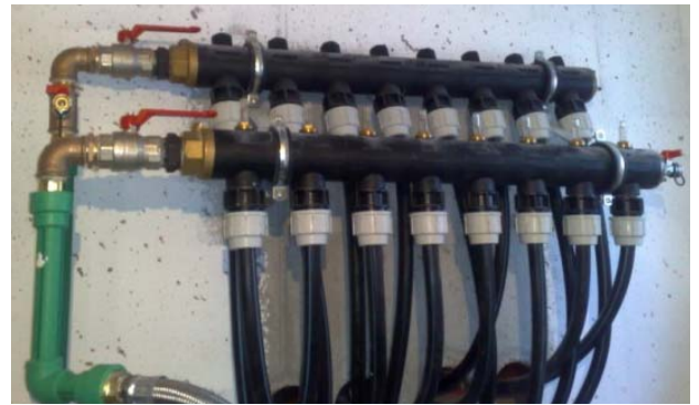
Verteilerbalken für beispielsweise 8 Stk. Energiesäulen (Vorlauf & Rücklauf)