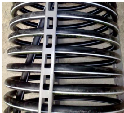
BACHNER Energiesäule mit ca. 10,5m Länge